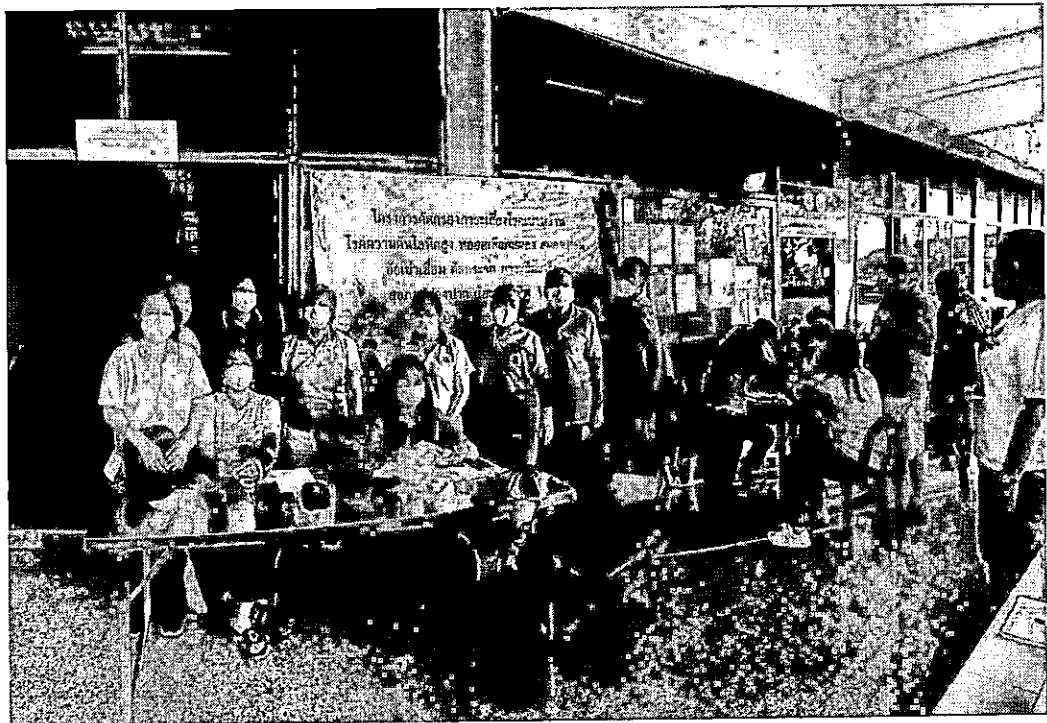
เจ้าหน้าที่ของโรงพยาบาลบางปลาหมอออกคัดกรองโรคเรื้อรังในประชากรกลุ่มเสี่ยงโรคเรื้อรังร่วมกับ อสม.ในเขตเทศบาลตำบลโคกคราม