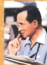
พระบรมฉายาภาพของพระบาทสมเด็จพระเจ้าอยู่หัว รัชกาลที่ ๙

คุณธรรม ๔ ประการ ที่พระบาทสมเด็จพระเจ้าอยู่หัว รัชกาลที่ ๙ พระราชทานแก่ประชาชนชาวไทย ประกอบด้วย ประการแรก คือการรักษาความสัจ ความจริงใจต่อตัวเอง รู้จักเสียสละประโยชน์ส่วนน้อยของคน เพื่อประโยชน์ส่วนใหญ่ของบ้านเมือง ประพฤติแต่สิ่งที่เป็นประโยชน์และเป็นธรรม ประการที่สอง คือการรู้จักข่มใจตัวเอง ฝึกใจตนเอง ให้ ประพฤติปฏิบัติอยู่ในความสัจ ความดี ประการที่สาม คือ การอดทน อดกลั้น และอดออม ไม่ ประพฤติล่วงความสัจสูงจริต ไม่ว่าจะด้วยเหตุประการใด ประการที่สี่ คือการรู้จักและวางความชั่ว ความทุจริต คุณธรรม ๔ ประการนี้ ถ้าแต่ละคนพยายามปลูกฝังและ บำรุงให้เจริญงอกงามขึ้นโดยทั่วกันแล้ว จะช่วยให้ ประเทศชาติ บังเกิดความสุข ความร่มเย็น และมีโอกาสที่จะปรับปรุงพัฒนาให้ มั่นคงก้าวหน้าต่อไปได้ดังประสงค์